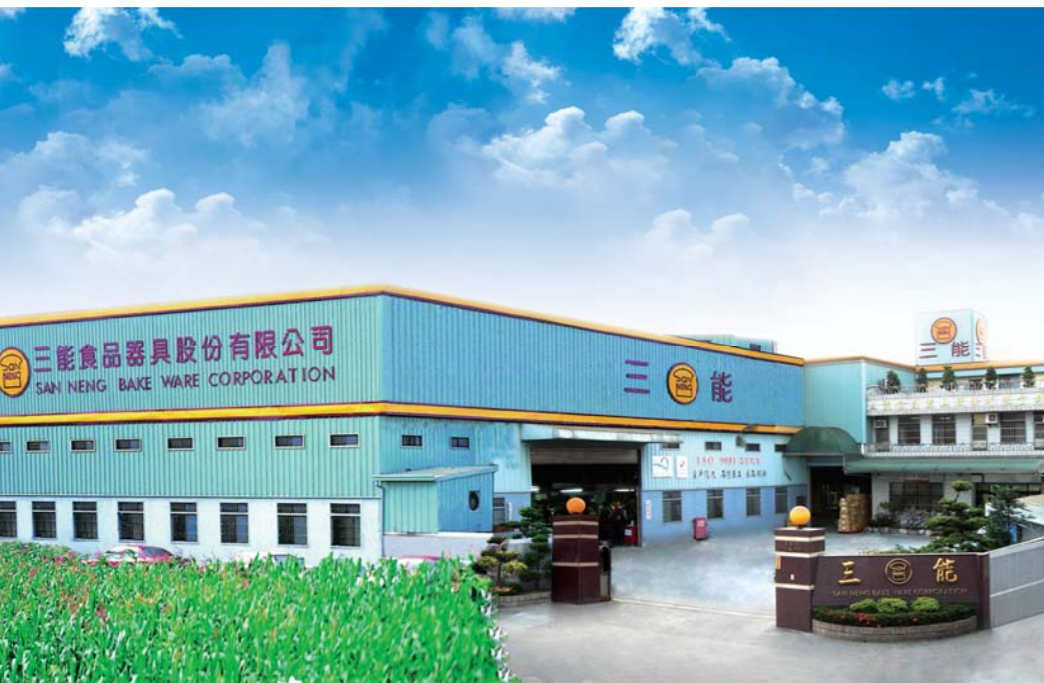
台湾三能食品器具株式会社