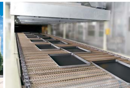
三能器具（無錫）有限公司の表面処理部