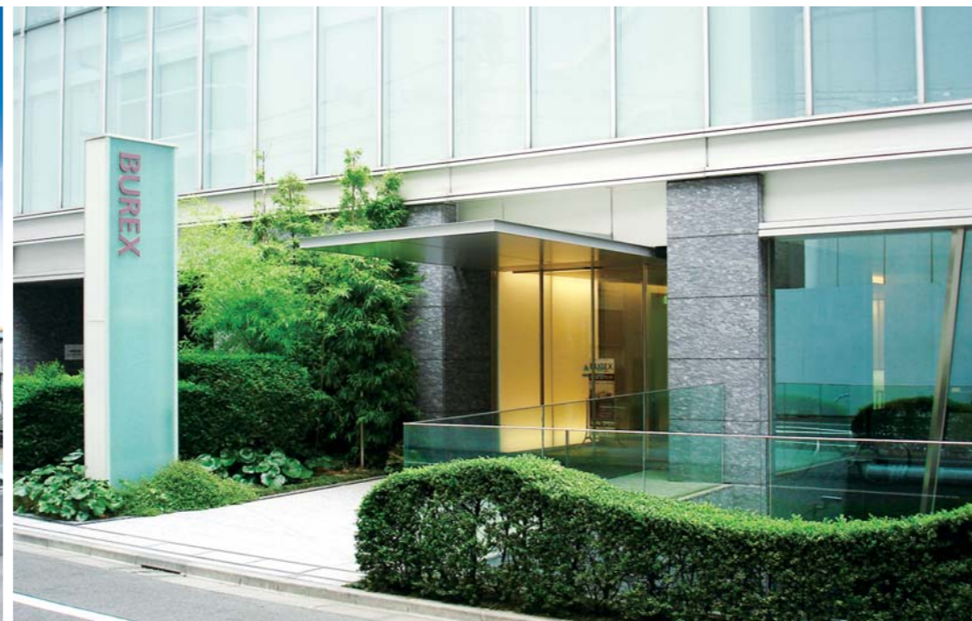
三能ジャパン食品器具株式会社