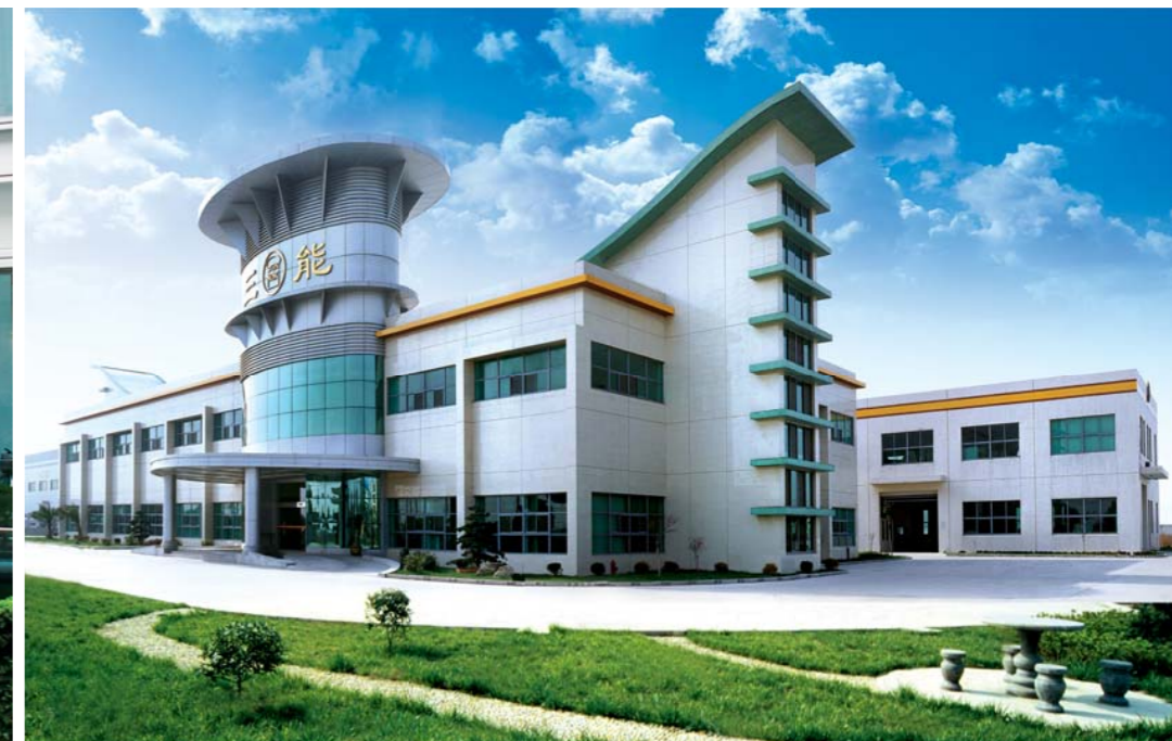
三能器具（無錫）有限公司