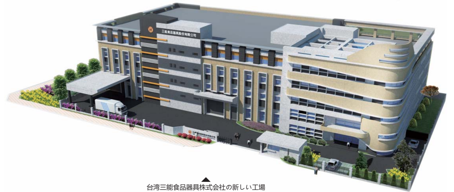
台湾三能食品器具株式会社の新しい工場