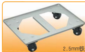
SN1982 平台车(喷漆) 610x410x125 耐重: 500kg