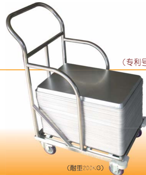
SN1999 层高: 126mm 适合6"蛋糕模 11层固定式6"蛋糕模冷却车(阳极)