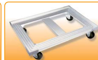
SN1985 铝合金平台车(阳极) 725x470x135 耐重: 250kg