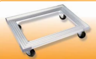
SN1987 铝合金平台车(阳极) 620x420x135 耐重: 250kg