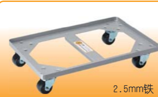
SN1986 平台车(喷漆) 725x470x135 耐重: 500kg