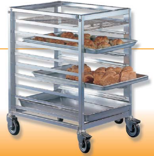
SN1998 层高: 126mm 适合8"蛋糕模 11层固定式8"蛋糕模冷却车(阳极)