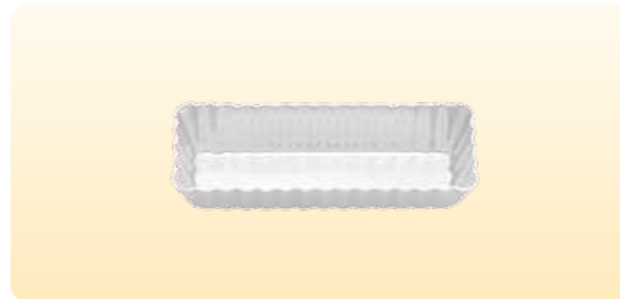
SN5423 固定长方型菊花派盘(阳极) 120x40x25