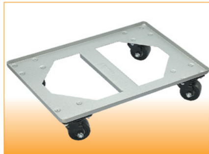
SN1982 平台车(喷漆) 2.5mm铁 610x410x125(耐重800kg)