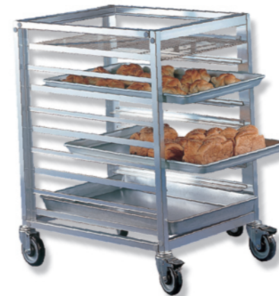
SN1971 16层固定式不锈钢台车 620x470x1730 层高：85mm 配套600X400烤盘