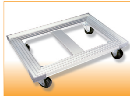
SN1985 铝合金平台车(阳极) 725x470x135(耐重250kg)