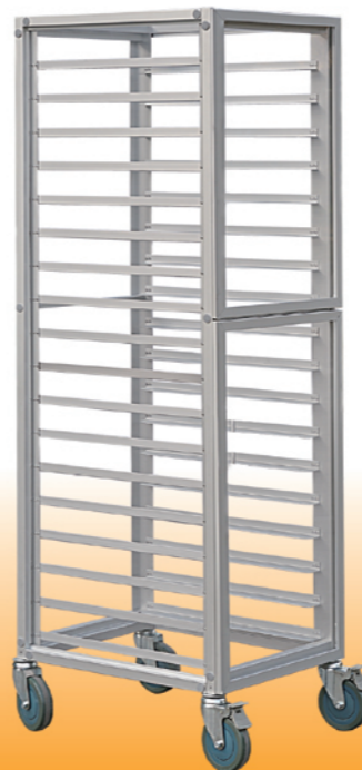
SN1961 18层固定密封式铝合金台车(阳极) 628x486x1700 层高：80mm 配套600X400烤盘