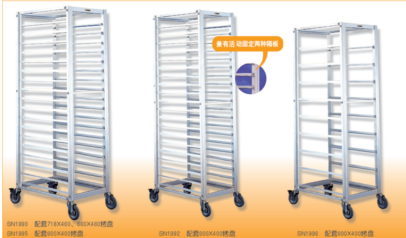
SN1990 配套718X460、660X460烤盘 SN1995 配套600X400烤盘