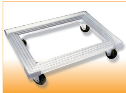
SN1987 铝合金平台车(阳极) 620x420x135(耐重250kg)