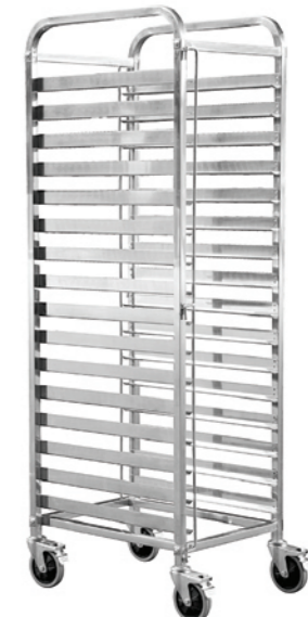
SN1997 9层固定式铝合金台车(阳极) 603x471x1003 层高：80mm 配套600X400烤盘