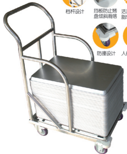
SN1980 不锈钢手推车 645x475x980 (耐重200kg) 专利号码：201120290936.4