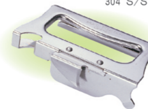
SN4776 开罐器 110x65x29