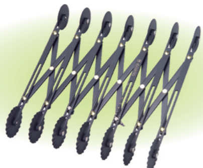
SN4220 7轮双用轮刀(不沾) 长度260