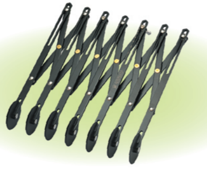
SN4226 7轮单用轮刀(不沾) 长度235