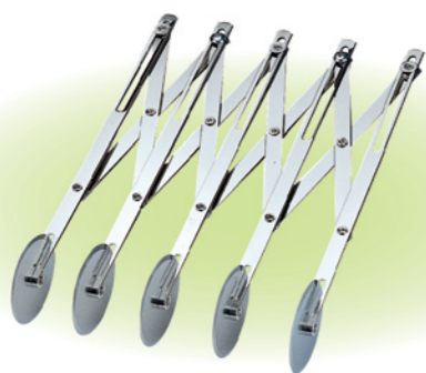
SN4223 5轮单用轮刀(电解) 长度235