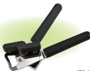
CRTH0003 手持式开罐器 185x50x50 (瑞士) 瑞士国旗