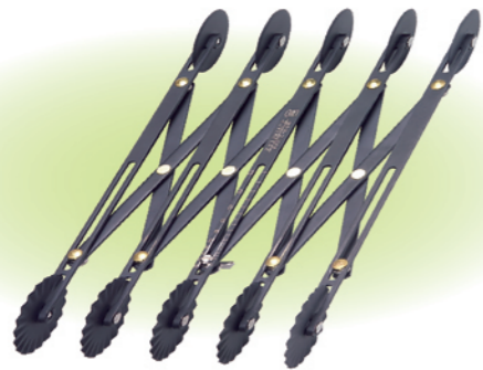
SN4219 5轮双用轮刀(不沾) 长度260

有刻度轮刀专利号码: 201020580613.4 高贵不贵! 仪器的品质, 工具的价格。