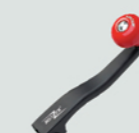
CRBZ0280 开罐器把手 塑料+钢 186x117