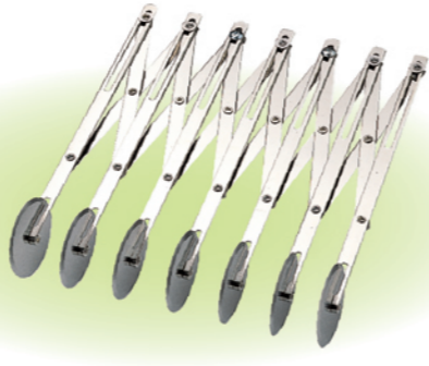
SN4224 7轮单用轮刀 长度235