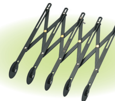
SN4225 5轮单用轮刀(不沾) 长度235