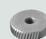
CRBZ0015 开罐器转轮 圆径40 孔径10