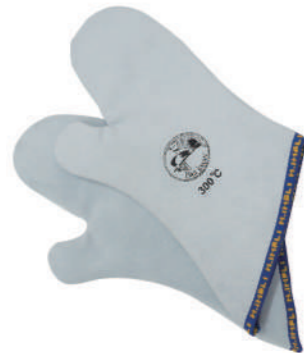
906/10 ¥5,900 耐熱ミトン 斜めカットタイプ 300°C 牛革 長さ360