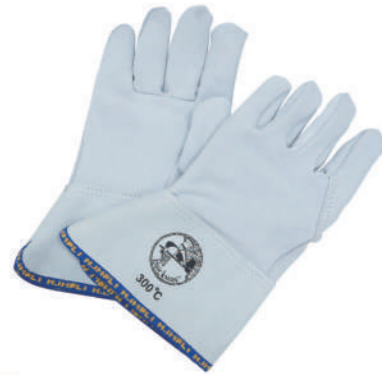
903/10 ¥6,900 耐熱ミトン 5フィンガータイプ 300°C 牛革 長さ310