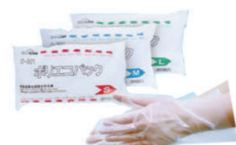
SAF-0026 ¥780 C17 スティック (200枚)ブルー PEプラスチック SAF-0026-S 全長280x掌周255x中指長75mm SAF-0026-M 全長280x掌周260x中指長78mm SAF-0026-L 全長280x掌周285x中指長82mm