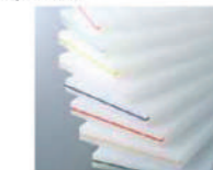
K型カラー差し込み(Bタイプ) ※カラー部分埋め込みタイプ ベージュ・ピンク・ブルー・赤・グリーン・濃ブルー・イエロー・濃ピンク