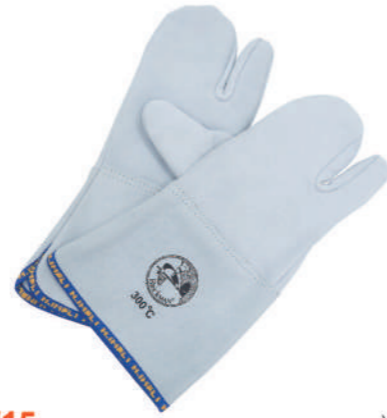
902/15 ¥5,900 耐熱ミトン 3フィンガータイプ 300°C 牛革 長さ350