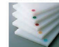
K型カラーめ込み(大) Ø24mm は表面のみ ピンク・ブルー・ベージュ・赤・グリーン