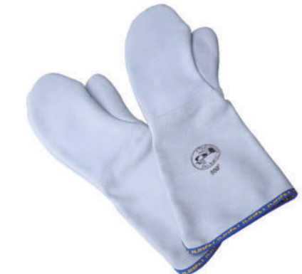
907/25 ¥13,900 18"耐熱ミトン-耐熱500°C 牛革 長さ450