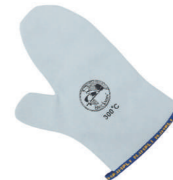
906/S ¥3,500 耐熱ミトン 片手のみタイプ 300°C 牛革 長さ310