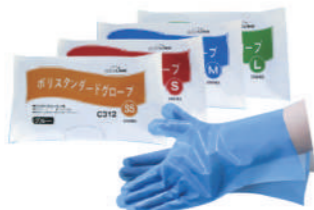
SAF-0025 ¥780 C19 スティック (200枚)ブルー PEプラスチック SAF-0025-S 全長280x掌周255x中指長75mm SAF-0025-M 全長280x掌周260x中指長78mm SAF-0025-L 全長280x掌周285x中指長82mm