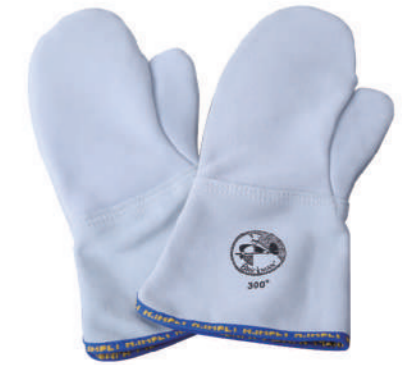
904/15 ¥5,900 14"耐熱ミトン-耐熱300°C 牛革 長さ350