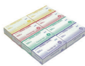
SAF-0031 ¥1,670 二枚手袋(有指)付(100枚)ブルー 合成ゴム SAF-0031-SS 全長240x中指長76x掌幅160mm SAF-0031-S 全長240x中指長79x掌幅170mm SAF-0031-M 全長240x中指長83x掌幅190mm SAF-0031-L 全長240x中指長84x掌幅210mm