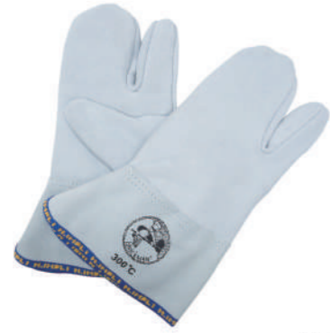
902/10 ¥5,500 耐熱ミトン 3フィンガータイプ 300°C 牛革 長さ310