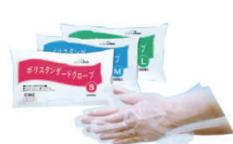
SAF-0024 ¥780 C17 スティック (200枚)ブルー PEプラスチック SAF-0024-S 全長280x掌周255x中指長75mm SAF-0024-M 全長280x掌周260x中指長78mm SAF-0024-L 全長280x掌周285x中指長82mm