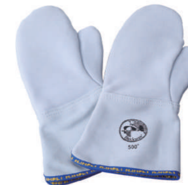
907/15 ¥12,300 14"耐熱ミトン-耐熱500°C 牛革 長さ350