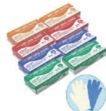
SAF-0030 ¥1,470 天然ゴム手袋 箱入(100枚) 天然ゴム SAF-0030-S 全長240x中指長73x掌幅85mm SAF-0030-M 全長240x中指長78x掌幅95mm SAF-0030-L 全長240x中指長80x掌幅105mm