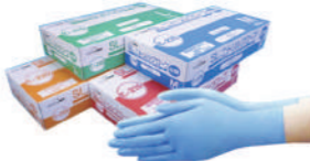
SAF-0033 ¥1,470 二枚手袋C215(100枚)ブルー 合成ゴム SAF-0033-SS 全長240x中指長70x掌幅160mm SAF-0033-S 全長240x中指長75x掌幅170mm SAF-0033-M 全長240x中指長80x掌幅190mm SAF-0033-L 全長240x中指長85x掌幅220mm