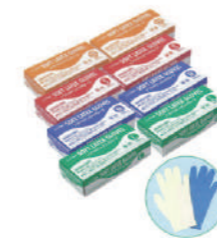
SAF-0034 ¥1,340 天然ラテックス手袋(100枚)ブルー 天然ゴム SAF-0034-S 全長240x中指長73x掌幅85mm SAF-0034-M 全長240x中指長78x掌幅95mm SAF-0034-L 全長240x中指長80x掌幅105mm