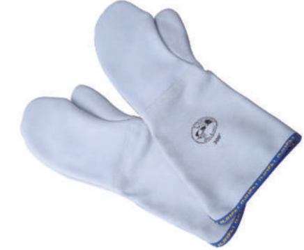
904/25 ¥7,000 18"耐熱ミトン-耐熱300°C 牛革 長さ450