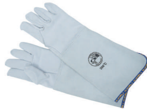
903/25 ¥8,000 耐熱ミトン 5フィンガータイプ 300°C 牛革 長さ450