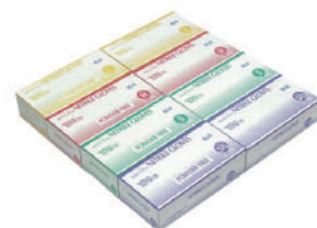
SAF-0029 ¥1,670 二枚手袋(無指)無し(100枚)ブルー 合成ゴム SAF-0029-SS 全長240x中指長76x掌幅160mm SAF-0029-S 全長240x中指長79x掌幅170mm SAF-0029-M 全長240x中指長83x掌幅190mm SAF-0029-L 全長240x中指長84x掌幅210mm