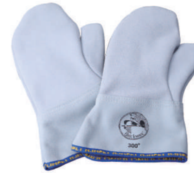
904/10 ¥5,500 12"耐熱ミトン-耐熱300°C 牛革 長さ310