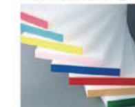
K型カラー(バンド張り(Aタイプ)) ※カラー部分張り付け接合タイプ ベージュ・ピンク・ブルー・赤・グリーン・濃ブルー・イエロー・濃ピンク