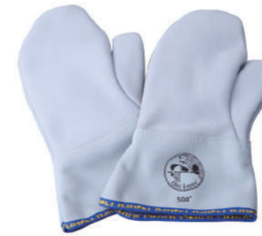
907/10 ¥11,400 12"耐熱ミトン-耐熱500°C 牛革 長さ310