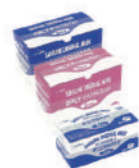
SAF-0018 ¥1070 2Pオゾン ナルマスク(100枚) 不織布 175x95