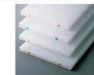
K型カラーめ込み(小) Ø9mmは側面のみ ピンク・ブルー・ベージュ・赤・グリーン