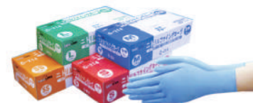
SAF-0032 ¥1,470 二枚手袋C214(100枚)ブルー 合成ゴム SAF-0032-SS 全長240x中指長70x掌幅160mm SAF-0032-S 全長240x中指長75x掌幅170mm SAF-0032-M 全長240x中指長80x掌幅190mm SAF-0032-L 全長240x中指長85x掌幅220mm