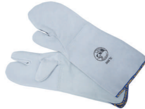
902/25 ¥7,000 耐熱ミトン 3フィンガータイプ 300°C 牛革 長さ450