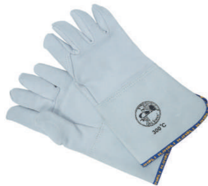
903/15 ¥7,300 耐熱ミトン 5フィンガータイプ 300°C 牛革 長さ350